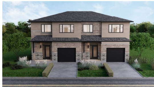
AGRANDISSEMENT MAISONS JUMELÉES PROJETÉES TYPE (Échelle 1:200)

CONSIDÉRANT QUE le formulaire d'appui du voisinage est cours de production;